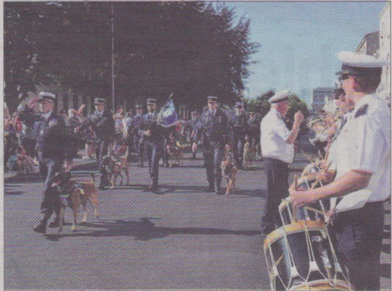
Les chiens du Centre national d'instruction cynophile de Gramat (Lot) ont également défilé rue du Docteur-Peltier.